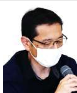
【新過程の観点別評価】

○澁谷(前高特)そもそも説明してから雇うべきもの。付随業務も交渉課題。非常勤だけでなく公仕の人権も大事にされていない。教職員としての誇りを持つ環境作りが必要。非常勤の冷遇事例を挙げると県教委は言うが、それはあなた方の仕事だとはつきり伝えたい。